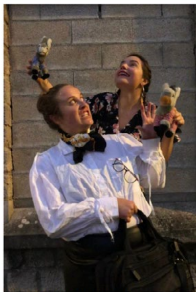
Les prestataires seront répartis en pleine rue, au plus près des habitants. D.R.

Programme : le 27 juin, à Charleville Mézières, le 1 er juillet à Saulz-lès-Reims et Alligny avec Les Musiciens du val, le 4 juillet à Fumay, le 5 juillet à Monthermé et le 6 juillet à Nouzonville, avec Ensemble Akadémia, le 11 juillet à Donchery avec L'Abri ouvert théâtre, le 12 juillet à Mouzon avec Les Musiciens du val et enfin le 12 juillet à Villers-Semeuse et le 13 juillet à Sedan avec L'Abri ouvert théâtre.