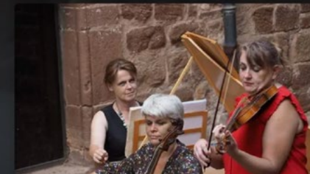
La compagnie des Monts du Reuil à Reims organise des tournées zéro émission carbone. Les Monts du Reuil